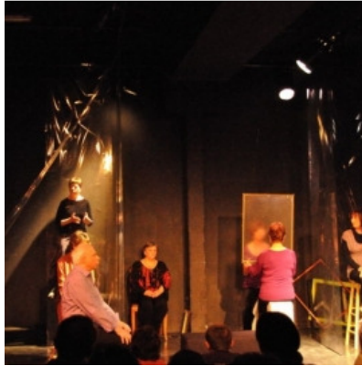
« Au bout du conte » Aubagne

Passé à ton voisin est un temps de découverte de l'univers du conte et un espace de formation à la pratique du conteur. Il est conçu pour allumer l'étincelle du merveilleux et de la présence de chacun et pour transformer le "Je ne sais pas faire" en "J'ai envie de vous dire" !